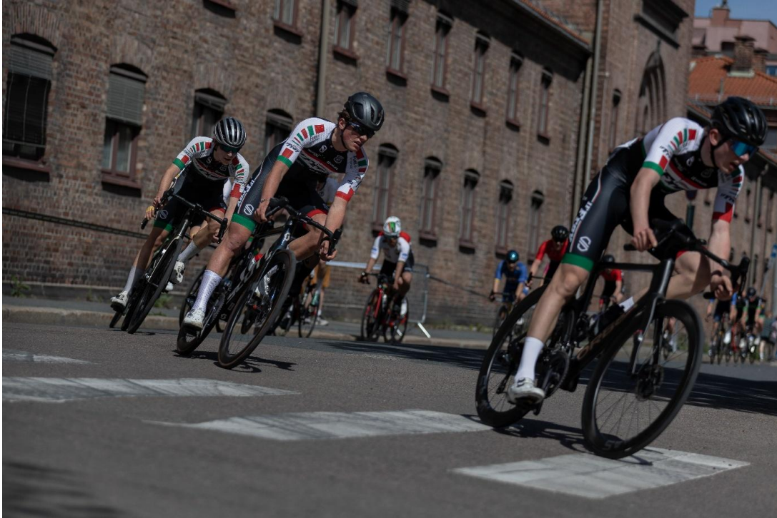
IF Frøy-syklister i aksjon under NM gateritt i regi av klubben.