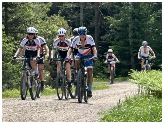
Det ble syklet 573 turer under Haukuka 2024.

Arrangementet er fortsatt et viktig sosialt møtepunkt for alle klubbens medlemmer, der alle de forskjellige gruppene i IF Frøy sammen har et felles prosjekt.