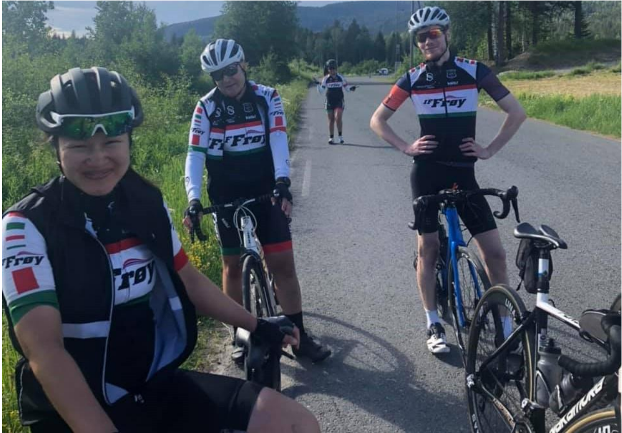
Gruppe 4 på landeveien rekrutterer mange nye medlemmer til IF Frøy. Her er gruppa på sommertur fra Lillehammer til Oslo via Hadeland.