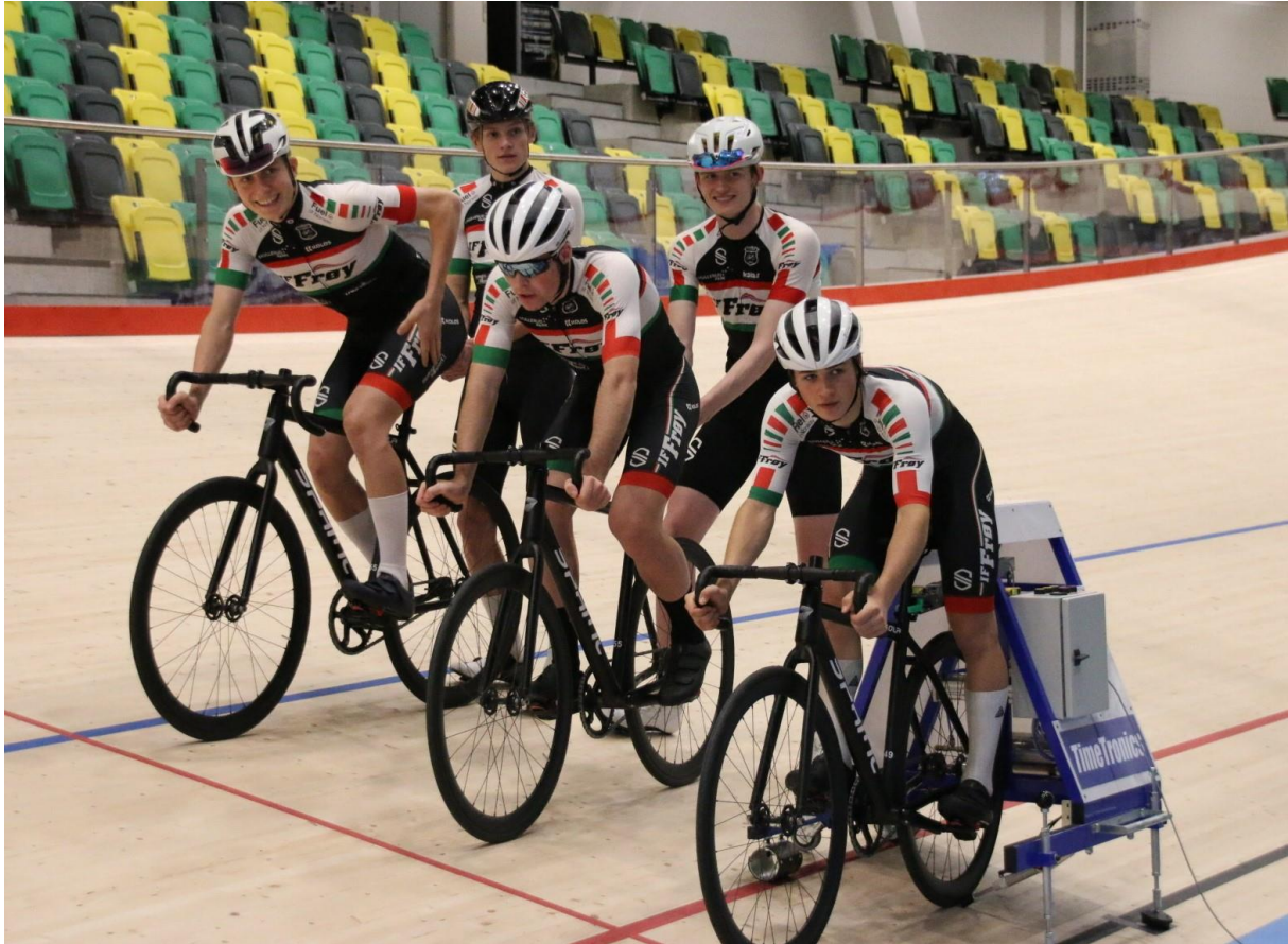
Frøys junior eliteryttere var de første fra klubben som fikk sjansen til å prøve velodromen i Sola.