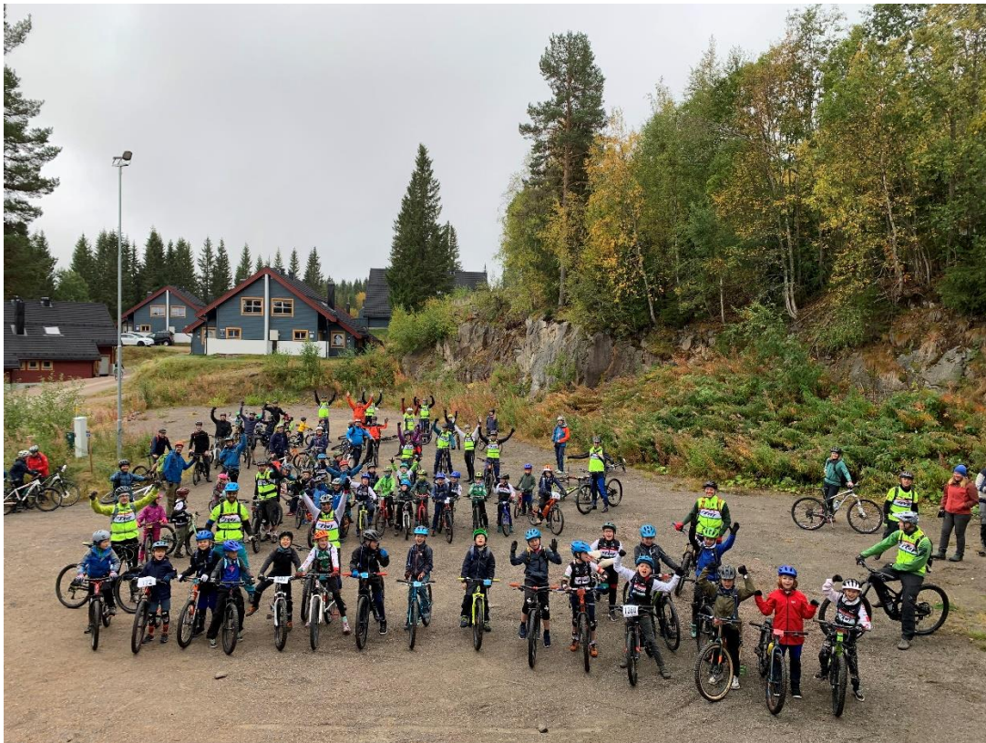
7-9-årsgruppene er klare for ny dag i Trysil