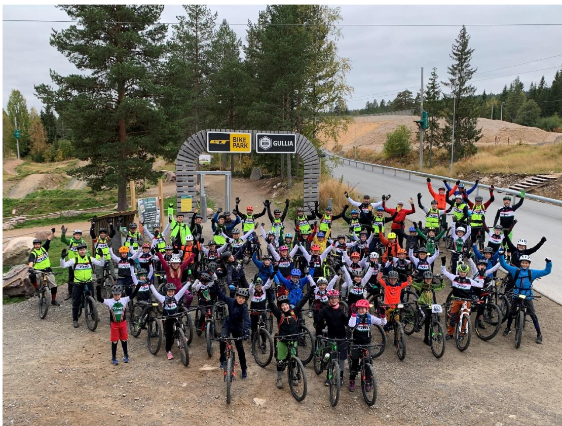
10-12-årsgruppene er klare for ny dag i Trysil

Alt i alt har over 190 barn og 50 trener deltatt på Frøy Kids sine aktiviteter. Vi har fortsatt mange barn på venteliste for 2022, men vi gjør hva vi kan for at flest mulig skal få muligheten til å delta.