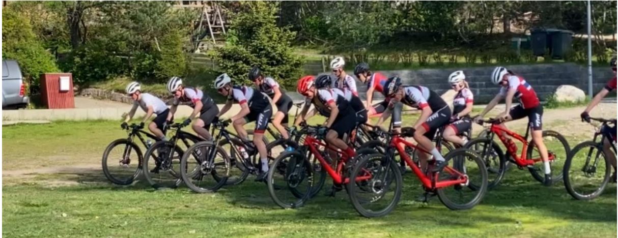
Start trening må til i terrengsykling 😊

Vi håper gjennom engasjement og tilrettelegging å få alle til å være med på videre satsning for å nå sine individuelle mål. Og takk til alle i IF Frøy som støtter oss og gir oss muligheten til å satse videre.