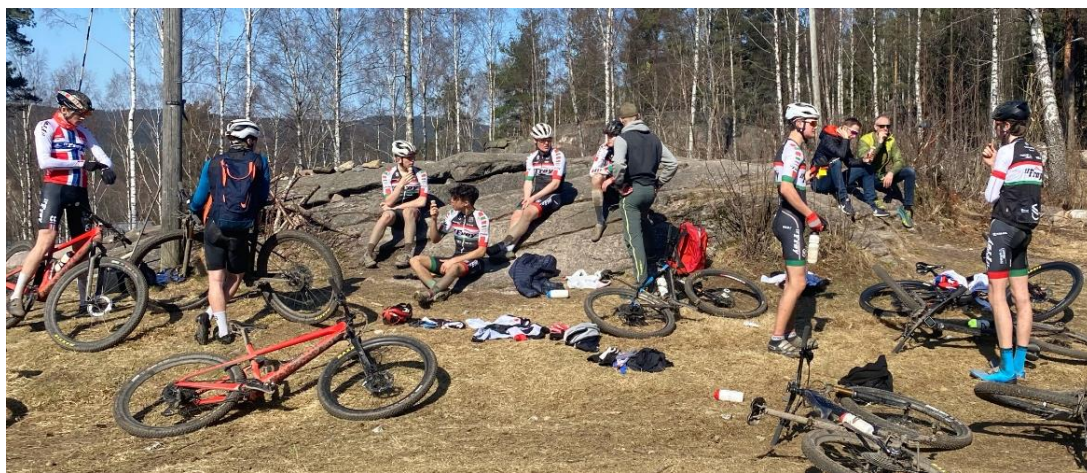
Resting etter intervall på Langsetløkka – April 2021

Vi har kjørt flere interne ritt på forsesong – dette ble gjennomført i vår fine treningsskog i nærrområde med god hjelp fra foreldre i gruppa, og med andre klubber i «klubbsamarbeid Region Øst».