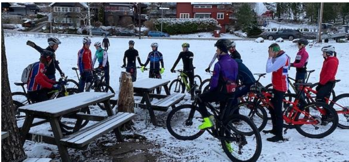
Fra fellestrening Langsetløkka 12. desember