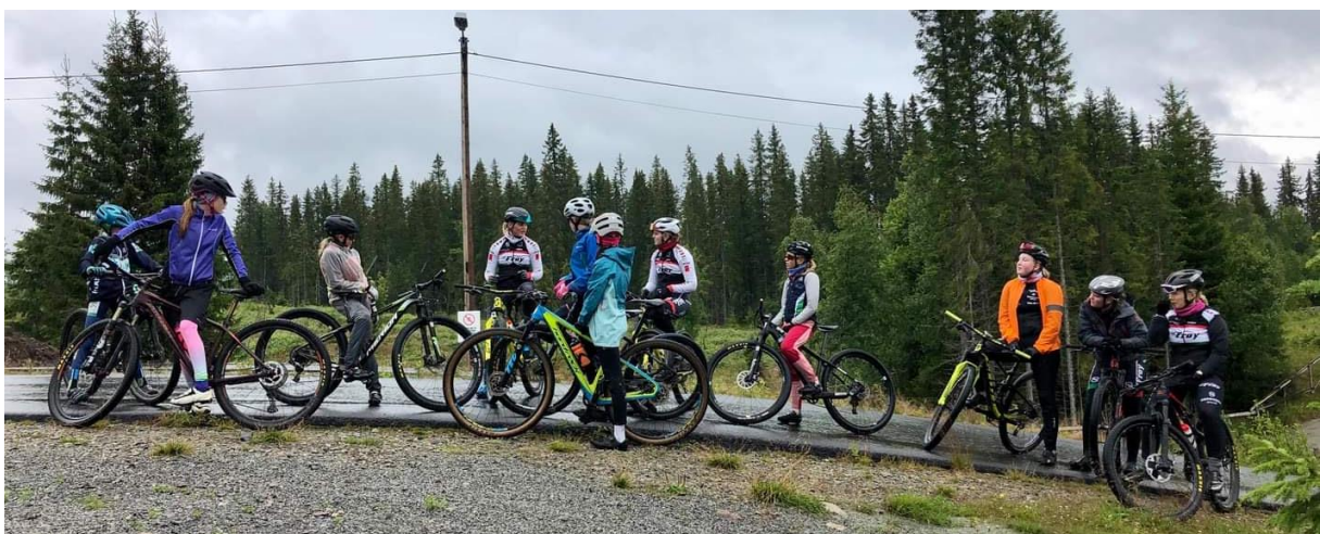
Jentedag med de yngre jentene i Brumunddal i regi av Frøy elite jr. og sr.

I sommerferien fikk vi jentene gleden av å arrangere en jentedag i Brumunddal hvor vi inviterte jenter fra de yngre klassene til en felles-trening med teknikkøkt og hardøkt for å forberede oss til NM. Utrolig gøy for oss å kunne bidra til å skape et bedre jente-miljø, noe vi alle brenner litt ekstra for. Veldig imponerende å se hvor høyt nivå det er på de yngre jentene! Dette håper vi å få til mer av i 2021.