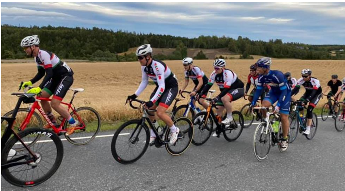
Klubbmesterskapet i fellesstart gikk i en ny trase i Ås. Den ble godt likt av deltakerne.