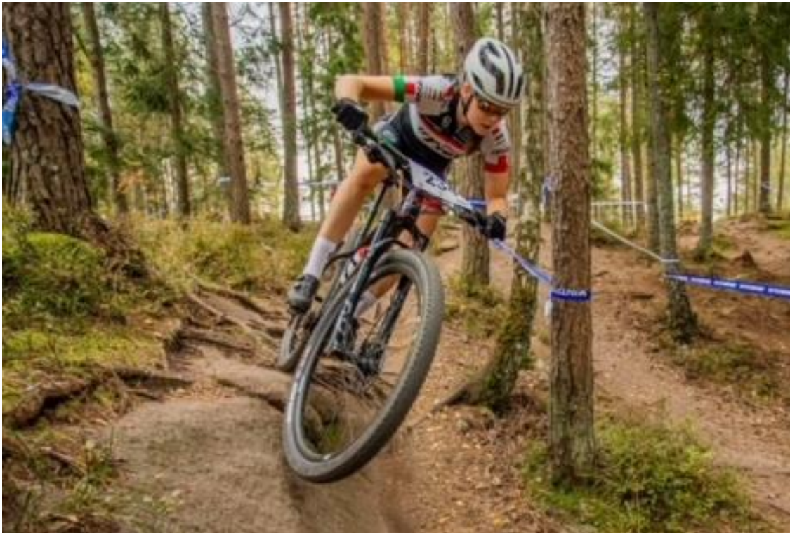
Oda på vei mot NM-seier

Vinnerne våre ble da samtidig regionsmestere !!!