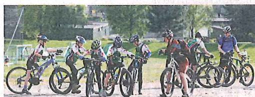
Terrensyklistene er en gruppe i vekst. På fem år har medlemstallet i Frøy doblet seg.

og at et generelt forbud mot sykling på blåmerkede stier ikke er veien å gå, skrev fylkesmannen etter at 47 av 51 høringsssvar var negative til forbud om forslag. Men det må søkes om å arrangere ritt i områdene som er foreslått vernet.